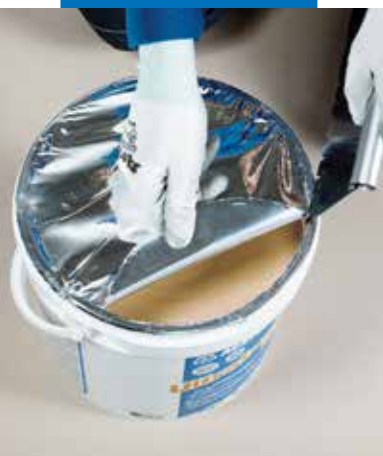
Facile e veloce rimozione della pellicola sigillante