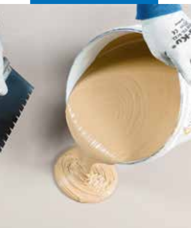
Facile applicazione sul sottofondo