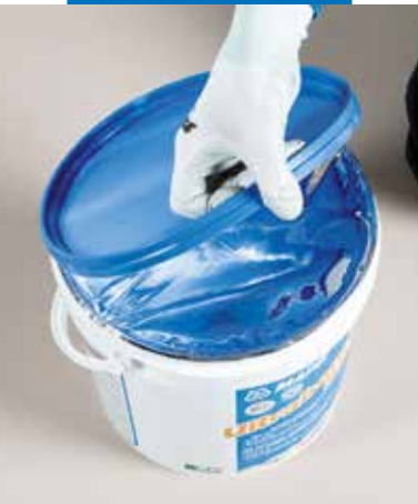
Facile rimozione del coperchio